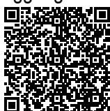
Puji Widodo SH Ketua TUK